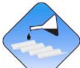
Hohe chemische Beständigkeit