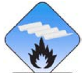
Brandklasse B1 (nicht brennend abtropfend)