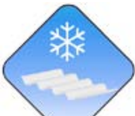
Widerstandsfähig bei niedrigen Temperaturen